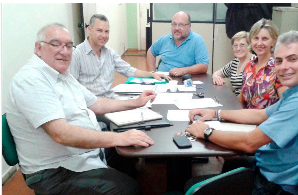
Em outubro 2014, a ACEAL iniciou seu processo de revitalização

Dentre esses projetos, estão o ajuste do Planejamento Financeiro da Asso-