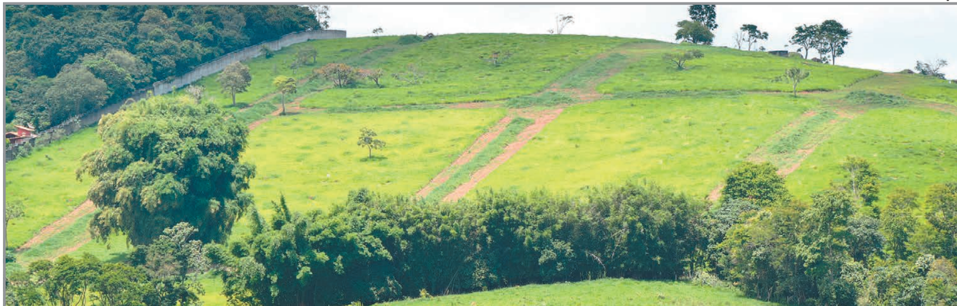
Residencial Monte Belo, próximo ao Thermas Water Park, teve, em menos de trinta dias, 30% das 247 unidades vendidas

ÁGUAS DE LINDÓIA – O momento econômico do país não está interferindo nos investimentos imobiliários da região. Com novos loteamentos e empreendimentos surgindo, o mercado continua aquecido e dando sinais de vigor. Prova disso é o novo empreendimento Residencial Monte Belo, próximo ao Thermas Water Park, onde em menos de trinta dias